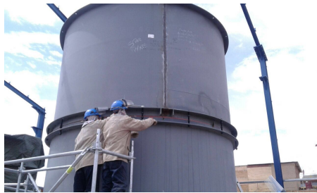
Montaje Cementera Oruro, Bolivia, cliente UTE Sacyr-Imasa