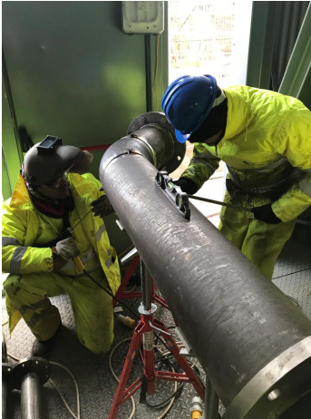
Piping Montaje y prefabricación piping, Escocia, Dumbar, proyecto Cementera, Cemengal