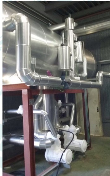
Montaje y fabricación, Frío industrial, IberFruta, Huelva