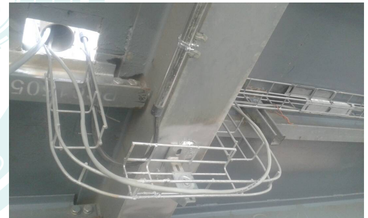
Montaje de Bandejas eléctricas, Proyecto Cementera Costa de Marfil, Technord