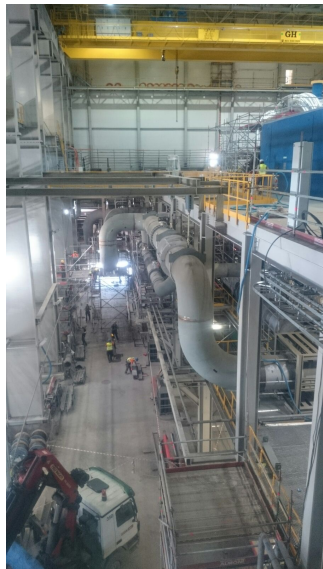
Fabricación y montaje proyecto, Ciclo Combinado, Stalowa Wola, Polonia, Abener