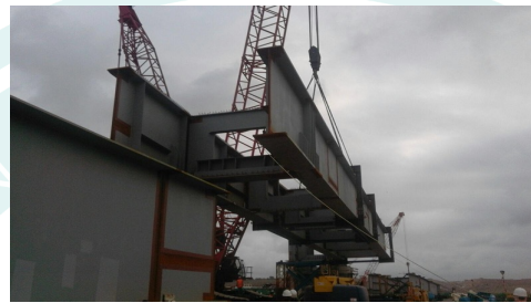
Montaje y fabricación, puentes del Ave Tanjér-Casablanca, clientes Moncobra y Martifer