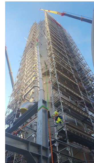
Planta Amoniaco, Posgrunn, Noruega, cliente Moncobra