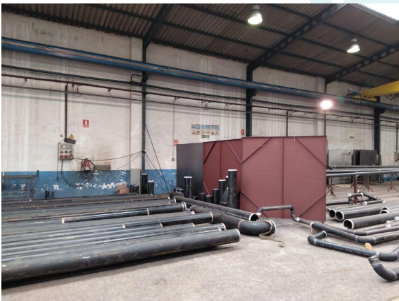
Prefabricado para Ampliación planta subproductos , Arcelor, Asturias