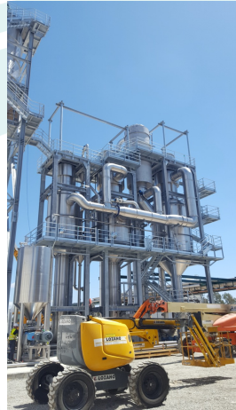
Planta alimentaria, Concentrado Tomate, Los Palacios y Villafranca (Sevilla), Grupo Algosur