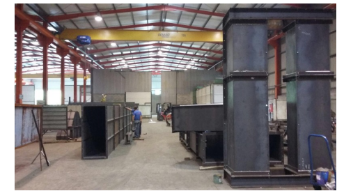
Fabricación de Conductos, proyecto Alemania, Berlín, ciclo combinado, Ditecsa