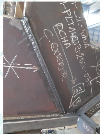
Calderería pesada, prefabricación de mamparo para cliente TECADE